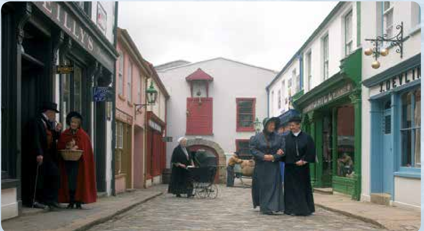
Ulster American Folk Park

Zum Abschluss nochmals ein Highlight: Der Ulster American Folk Park“ gehört zu den eindrucksvollsten Freilichtmuseen Europas. Hier spaziert man im wahrsten Sinne des Wortes durch die Geschichte der Emigration vieler Iren nach Amerika – und wie sie dort lebten und was aus ihnen wurde. - Nachmittags Rückflug nach Frankfurt.